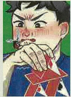
單頁漫畫【高中生部門】(忍耐) 作品名:即將完成 筆名:CYBER鈴木