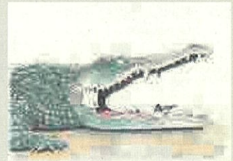
單頁漫畫【自由部門】(約定) 作品名:鱈魚與牙籤鳥的約定 筆名:小林尚武(NAOTAKE)