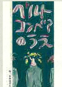
故事漫畫【自由組】 作品名:在傳送帶上 筆名:NARUHANOTO