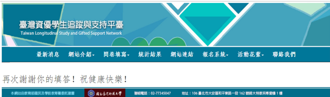
圖 24 問卷完成頁面

13. 問卷完成頁面：出現 再次謝謝你的填答！祝健康快樂！ 即完成問卷填答，如圖 24 所示。