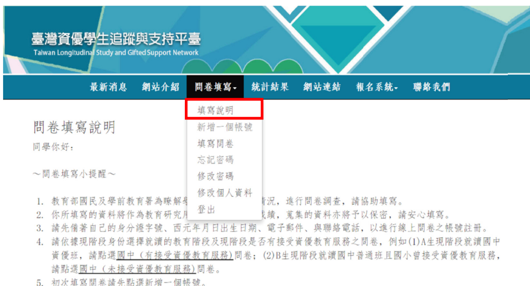
圖 3 填寫說明