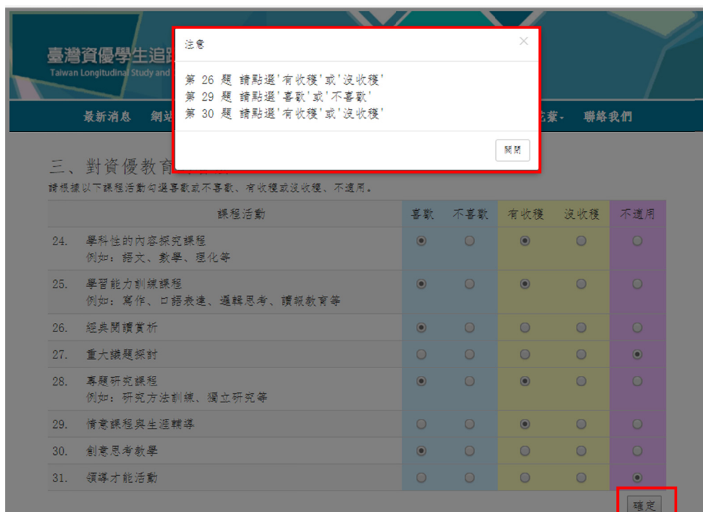
圖 15 課程活動作答不完整