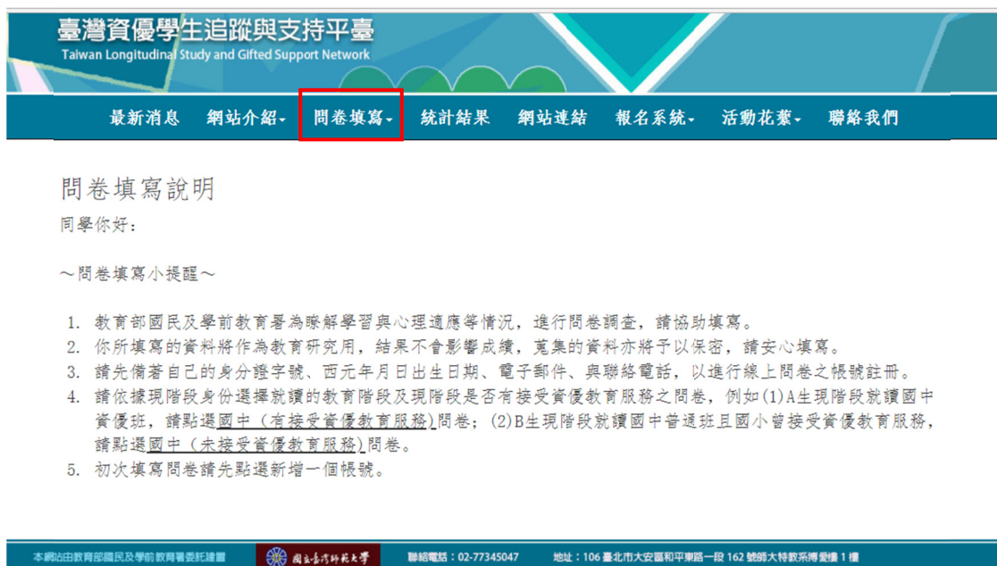
圖 2 問卷填寫