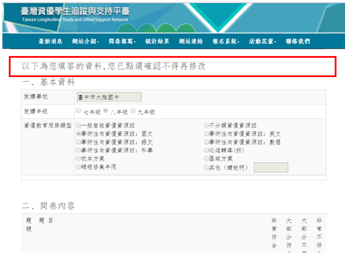
圖 25 問卷填答完畢不得再修改頁面

14. 問卷填答完畢不得再修改：學生若問卷填寫並送出後，將不得再修改，如圖 25 所示。