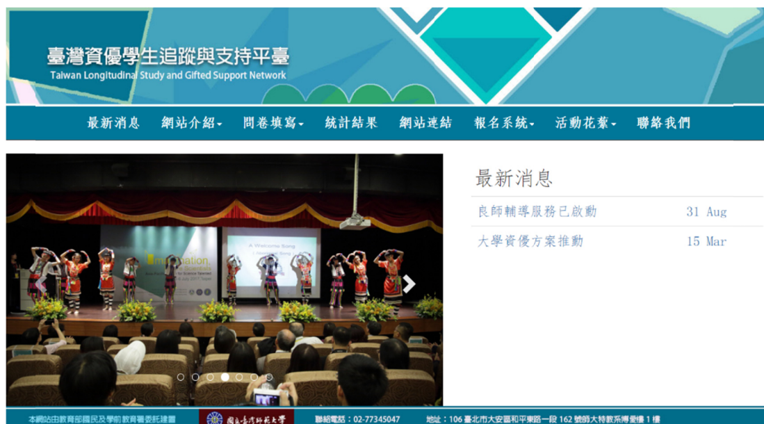
圖 1 臺灣資優學生追蹤與支持平臺